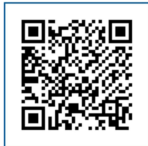
Mã QR về thông tin tài khoản thanh toán

Sau khi chuyển khoản thành công, chụp lại màn hình và đính hình ảnh lên mục “Upload minh chứng nộp học phí nhập học”